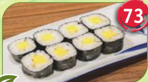
+ Tamago Omelett aus Ei