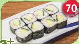
+ Kappa Gurke

Kombination „ Moziawase “ 3er-Set 9,90 €