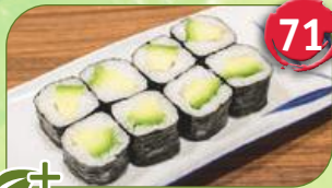
+ Avocado Avocado