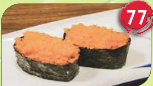
Masago rot Rogen rot