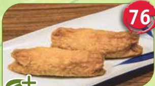
+ Inari frittierte Tofu, süß eingelegt