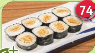
+ Inari fritierter Tofu mit Sesam