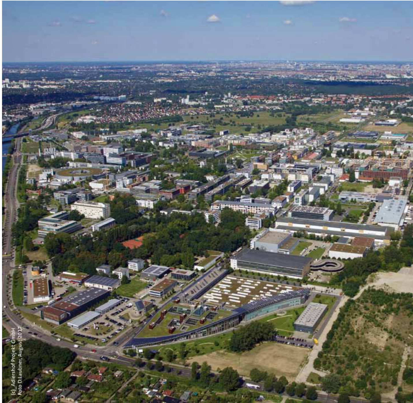
(c) Adlershof Projekt GmbH Foto D. Laubner, August 2017