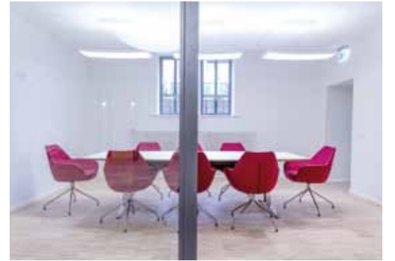
Konferenzraum Conference Room