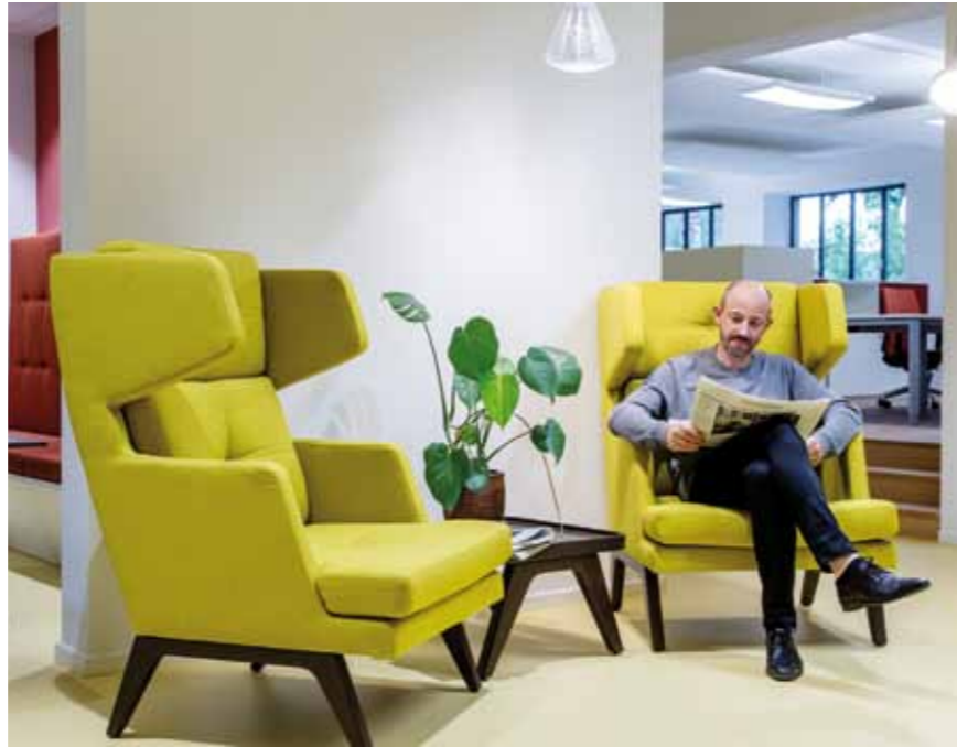
„Think Tank“ „Think Tank“