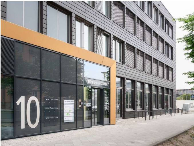
EUROPA-CENTER am Forum