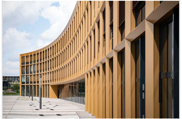
EUROPA-CENTER am Forum