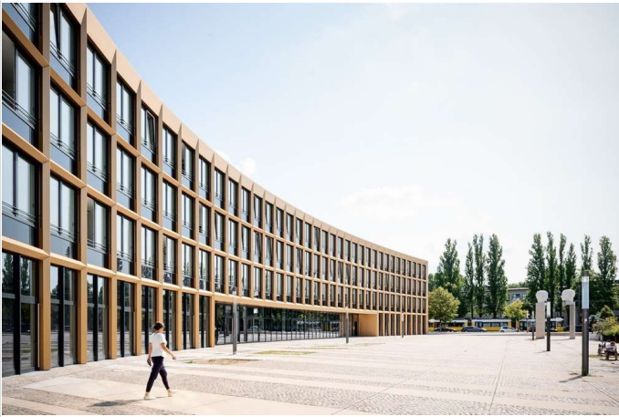
EUROPA-CENTER am Forum

Miet-/Kaufobjekt: Miete Büro-/Praxisfläche: 220,70 m 2 Miete pro m 2 : 18,00 EUR