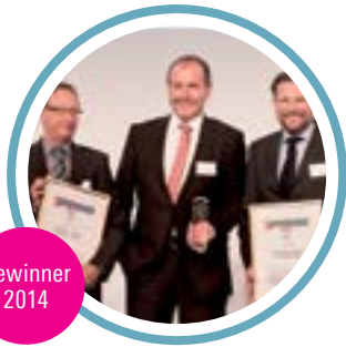
egrid applications und consulting GmbH