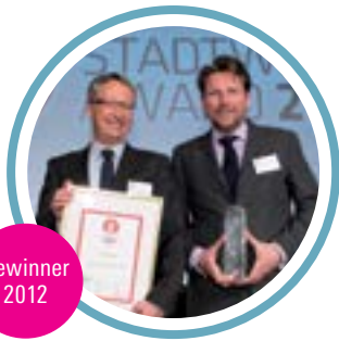
Allgäuer Überlandwerk GmbH