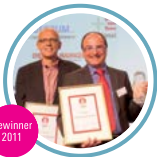
Stadtwerke Bielefeld GmbH