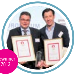
Stadtwerke Bonn GmbH